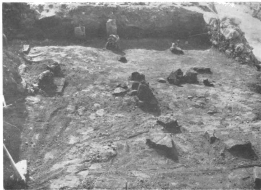
Fig. 4. — Bumbești-Jiu, hypocaustum de la termele romane.