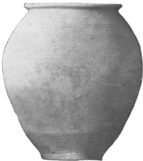
Fig. 3. — Bumbești-Jiu, oală din ceramică cenușie (î 0,295 m) din așezarea civilă romană.