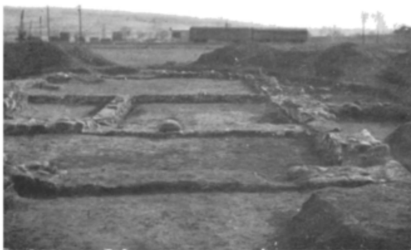
Fig. 1. — Bumbești-Jiu, temelile unei locuințe (D) din așezarea civilă romană.